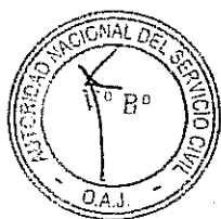
EDMUNDO BETETA OBREROS Presidente Ejecutivo AUTORIDAD NACIONAL DEL SERVICIO CIVIL