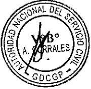
NURIA ESPARCH FERNANDEZ Presidenta Ejecutiva AUTORIDAD NACIONAL DEL SERVICIO CIVIL

Regístrese, comuníquese, publíquese y archívese.